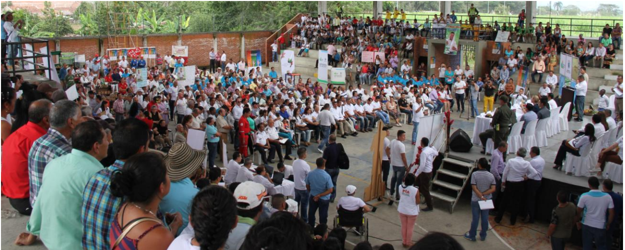
Vallecaucana de Aguas/ conversatorio ciudadano “El Valle está en Vos”, municipio de Riofrío